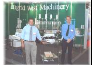
Standul de anul trecut IWM la CWIEME 2004